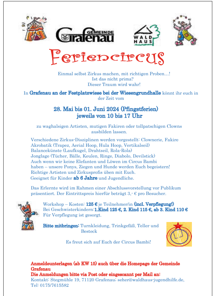
Plakat: Michael Seher